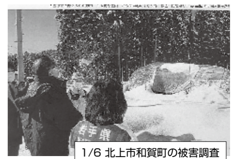
1/6 北上市和賀町の被害調査